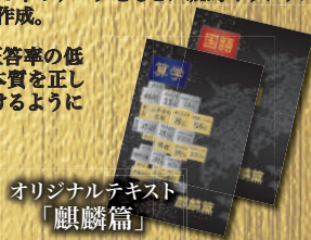
オリジナルテキスト「麒麟篇」

千葉県高校入試の正答率の低い難問も小学生で本質を正しく学べば簡単に解けるようになります。